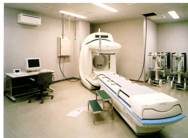
M R I