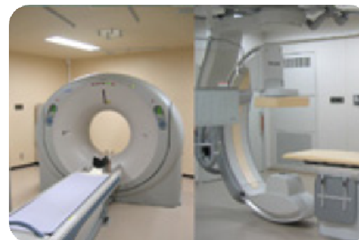
画像診断センター